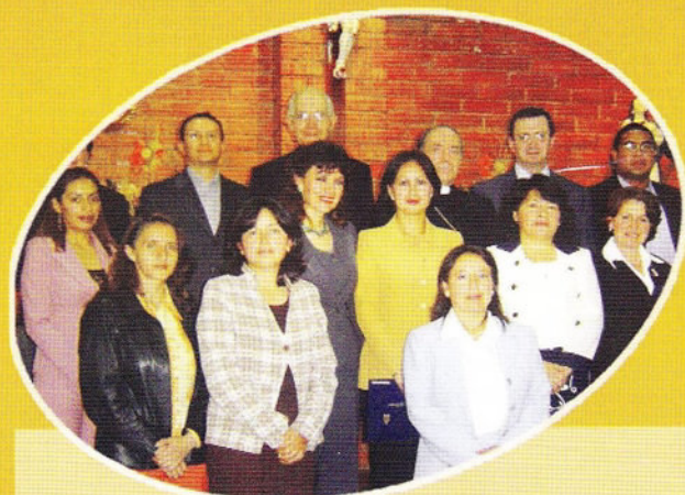
Visita a la PUCE-SI del Nuncio Apostólico su Excelencia Giacomo Guido Otonello.