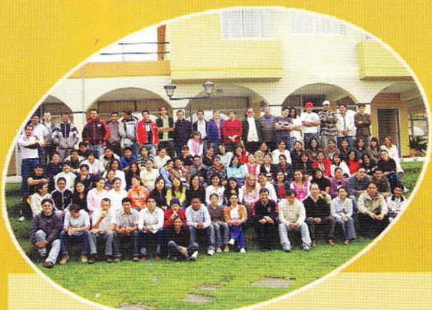
Jóvenes del norte del país participaron en el Motus Christi, encuentro de espiritualidad y convivencia.