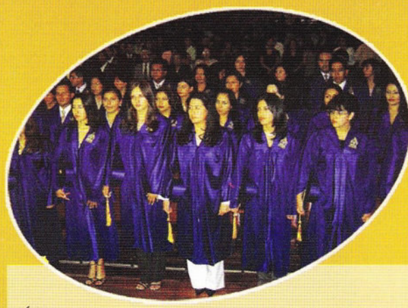
Última incorporación de nuevos profesionales de las diferentes unidades académicas de la Sede.