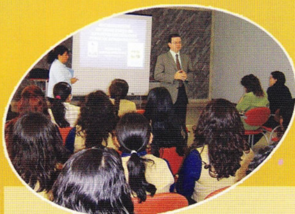
Socialización del Informe Final de Autoevaluación Institucional al personal administrativo de la PUCE-SI.