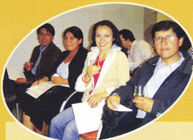
Acto de entrega de certificados "First Certificate" organizado por la Escuela de Lenguas y Lingüística.