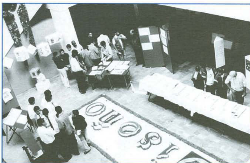
La Escuela de Diseño participa activamente en exposiciones.

La creación de esta red, si bien supone la incorporación de las Escuelas de Diseño de la Pontificia Universidad Católica del Ecuador (Quito, Ambato, Ibarra) y los respectivos grupos de trabajo de las universidades participantes, tres españolas y tres iberoamericanas como son: Universidad Politécnica de Valencia (España), Universidad de