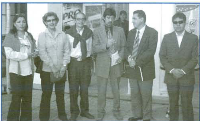
Docentes de Diseño estuvieron en el evento.