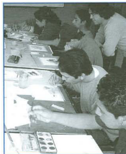
Estudiantes de Diseño en el taller de dibujo.

Igualmente "en la época contemporánea, ningún estado, al igual que ninguna institución universitaria o de otra naturaleza, por más poderosa que sea, puede llenar debidamente su