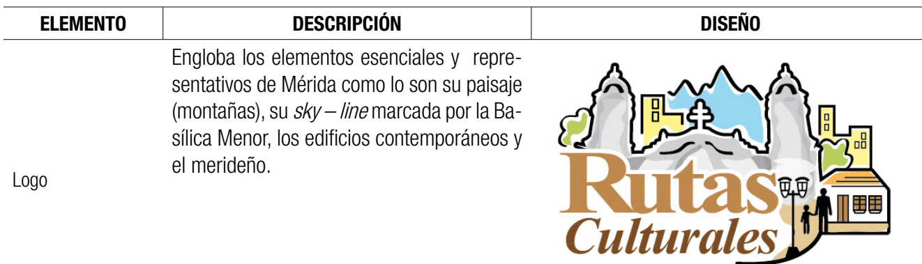
Figura 2. Logo Rutas Culturales. 2016

Un total de ocho edificaciones ubicadas en la retícula con valor tradicional de la ciudad (casco central), forman parte de la ruta diseñada. Esta